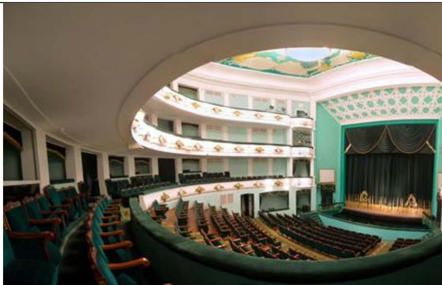
Государственное бюджетное учреждение культуры «Волгоградский государственный театр «Царицынская опера»